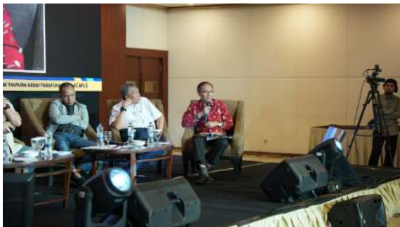
Gambar 36. Sesi Tanya Jawab