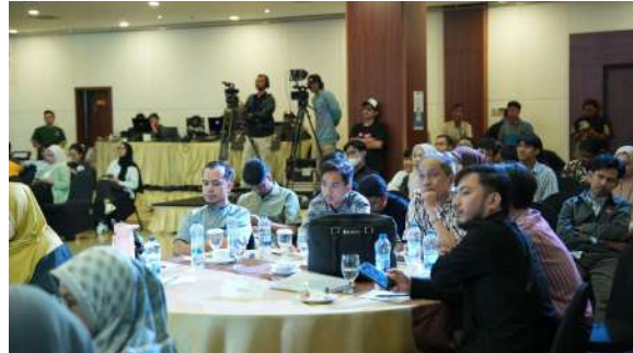
Gambar 47. Peserta Kegiatan