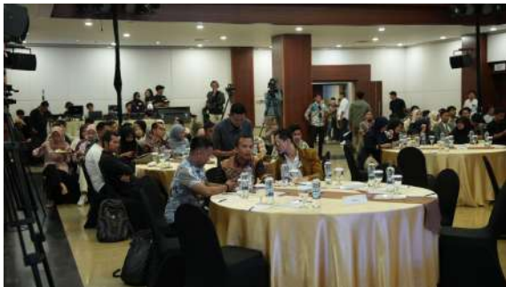
Gambar 48. Peserta Kegiatan