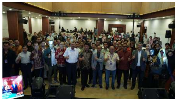
Gambar 45. Foto Bersama Peneliti dan Peserta Kegiatan