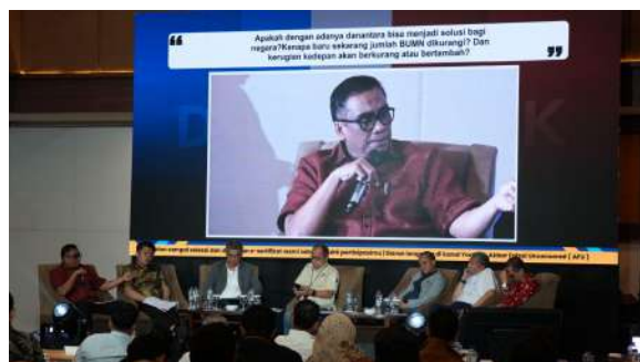
Gambar 35. Sesi Tanya Jawab