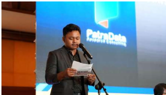
Gambar 42. Penutupan Acara oleh MC