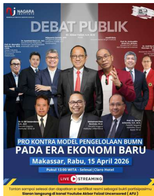
Gambar 1. Flyer Kegiatan Debat Publik “Pro Kontra Model Pengelolaan BUMN Pada Era Ekonomi Baru”

Tempat : Claro Hotel Makassar, Sulawesi Selatan