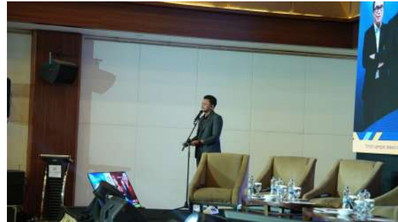
Gambar 9. Pembukaan Acara oleh MC