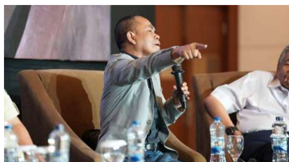
Gambar 37. Sesi Tanya Jawab