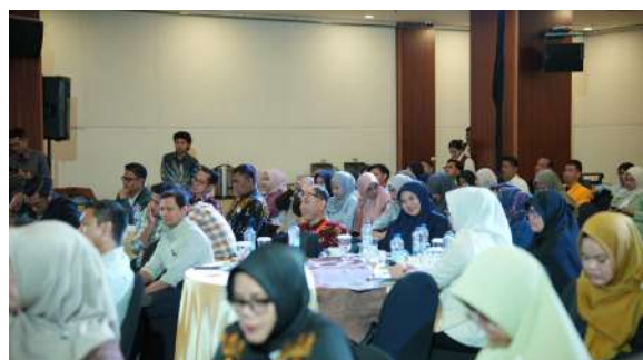
Gambar 49. Peserta Kegiatan