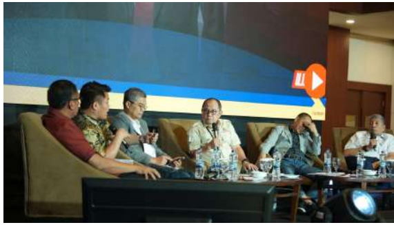
Gambar 38. Sesi Tanya Jawab