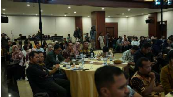
Gambar 46. Peserta Kegiatan