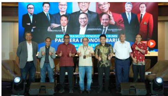
Gambar 44. Foto Bersama Peneliti dan Peserta Kegiatan