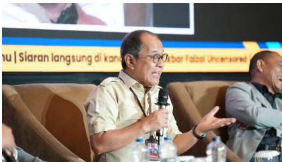
Gambar 34. Sesi Tanya Jawab