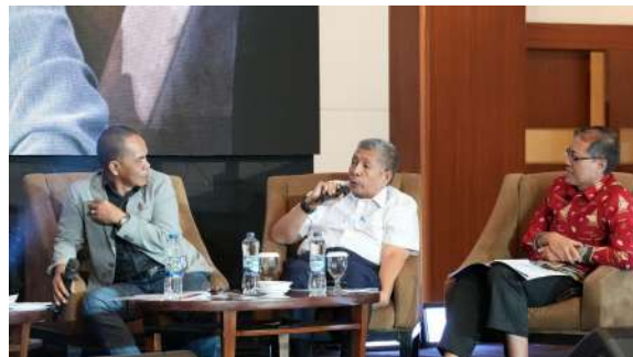
Gambar 29. Sesi Debat Publik