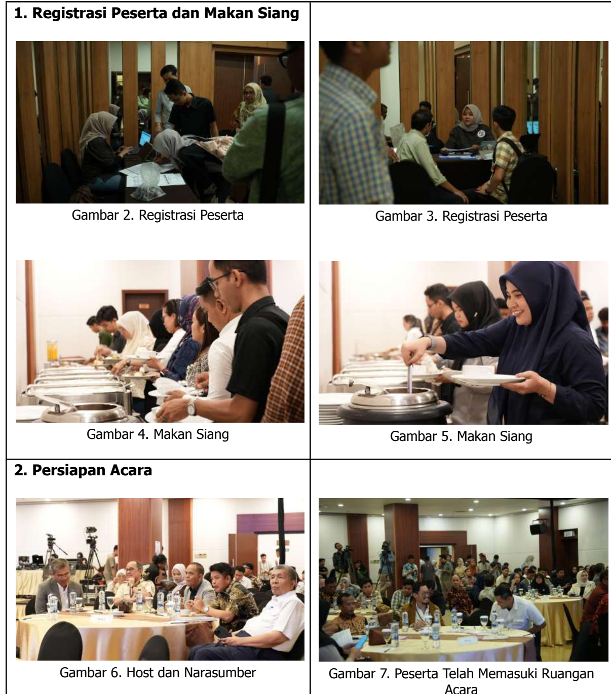
Tabel 3. Dokumentasi Kegiatan