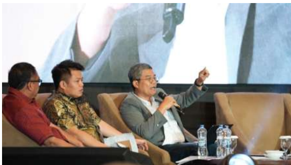
Gambar 28. Sesi Debat Publik