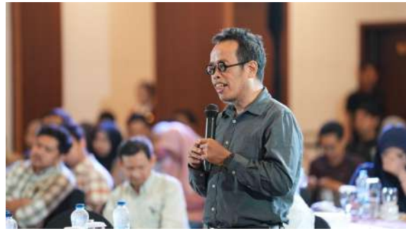
Gambar 39. Sesi Tanya Jawab