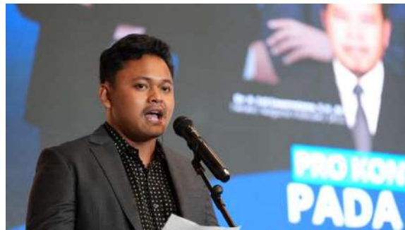
Gambar 43. Penutupan Acara oleh MC