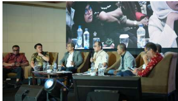
Gambar 41. Penutupan Sesi Diskusi oleh Host