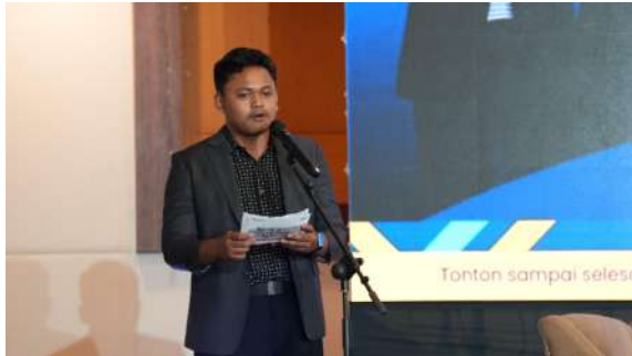
Gambar 8. Pembukaan Acara oleh MC