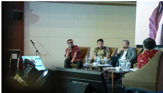
Gambar 40. Sesi Tanya Jawab